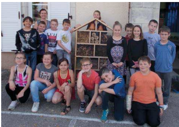
Ci-contre l'hôtel construit à l'école de Bayel par la classe de CM1/CM2.

La collectivité a souhaité sensibiliser les écoliers du territoire à la notion de biodiversité et a pris l'attache du CPIE de Soulaines. La prestation du CPIE s'est déroulée en deux temps : le CPIE du Pays de Soulaines devait, dans un premier temps, réaliser des animations auprès des écoles de la CCRB. Ces animations ont permis d'informer les enfants sur les insectes et la nécessité de les protéger.