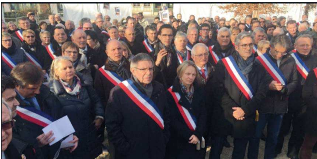
Discours du Président devant de nombreux élus le 16 décembre 2016 à Troyes

Néanmoins, les élus locaux ne veulent pas baisser les bras, une commission devenir de Clairvaux a été constituée lors de la réunion du conseil plénier du 23 mars 2017 afin de réfléchir à la possibilité de reconversion de Clairvaux. Il est important de montrer à nos autorités gouvernementales que le site mérite d'être valorisé et qu'il ne peut en aucun cas tomber en désuétude.