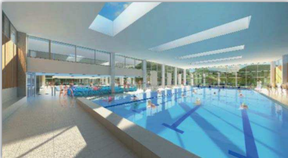
Vue intérieure du nouveau complexe aquatique

Après les analyses réglementaires courant septembre et octobre, les travaux débuteront début novembre par la démolition et sont programmés pour se terminer au printemps 2019.